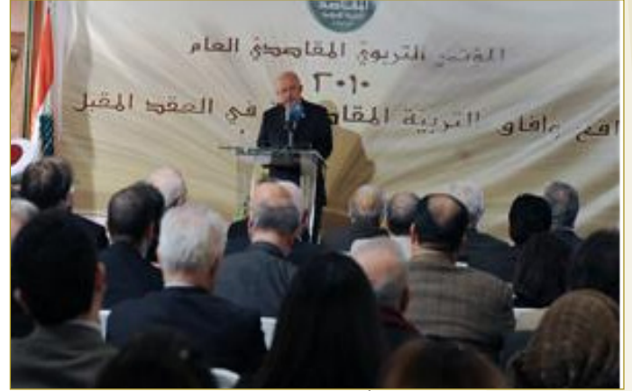
الداعوق متحدثاً خلال افتتاح المؤتمر (بلال قبلان)

وأكد الداعوق في كلمته على أن مجلس الأمناء في الجمعية أعاد حديثاً صياغة الرؤية والرسالة المقاصديتين ليعطي المقاصديين توجهاً أقوى وتفهماً أعمق لجمعيتهم.