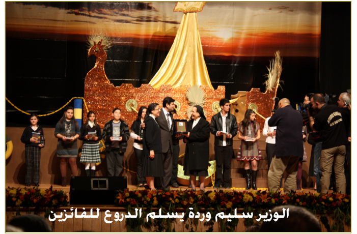
الوزير سليم وردة يسلم الدرود للمفاتيح

أخيراً ورّع الوزير وردة الدرود على تلامذة متفوقين في مجال كتابة القصة وألقى كلمة للمناسبة أكد فيها أنه علينا أن نجعل الكتاب أسلوب حياة!